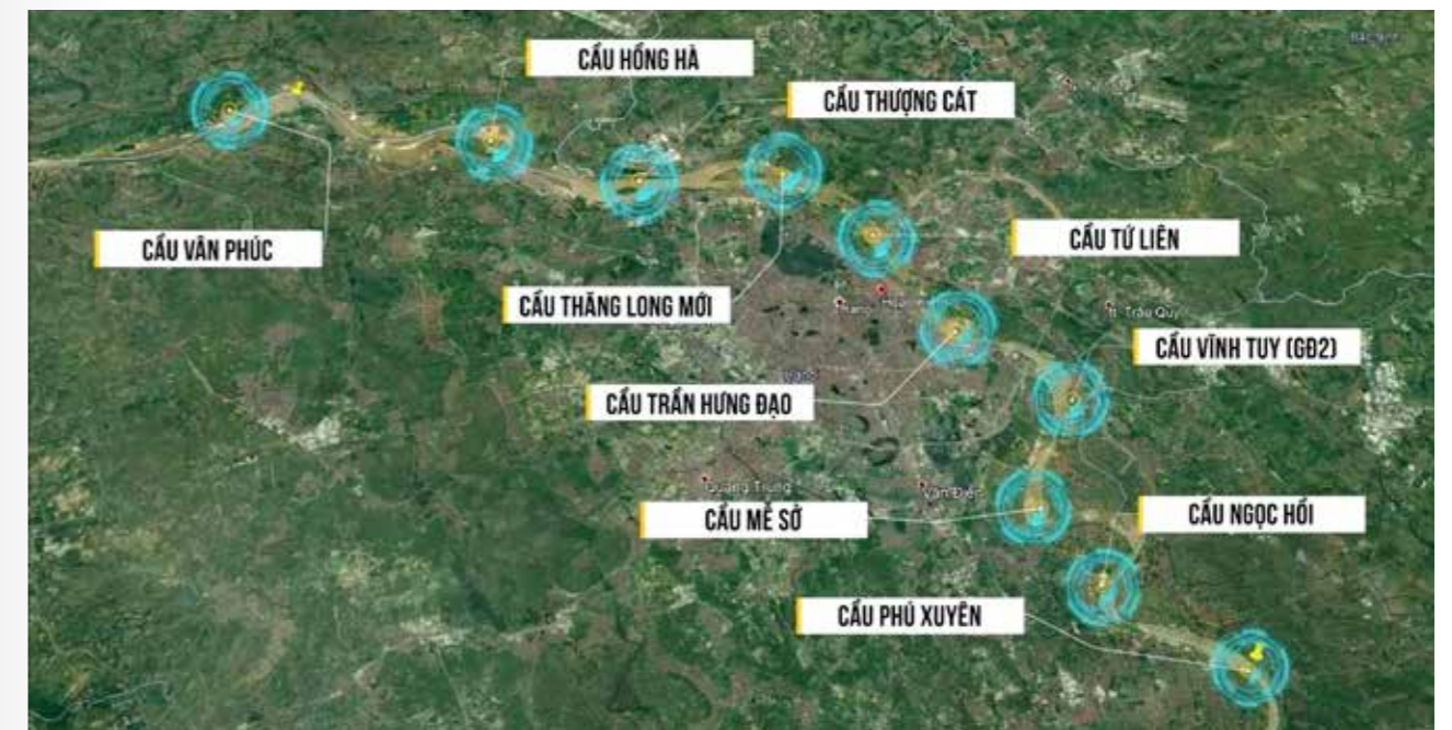
10 cây cầu mới bắc qua sông Hồng là giải pháp căn cơ và dài hạn giúp tăng kết nối giao thông liên vùng Thủ đô