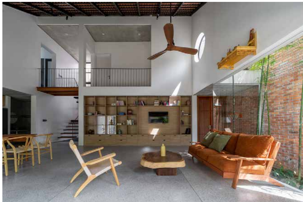
Với những không gian mở, gia chủ có thể dễ dàng điều chỉnh vị trí nội thất theo nhu cầu.

"Có thể có những thay đổi chưa hợp lý về kỹ thuật như hơi cản trở lối đi nhưng bạn cứ mạnh dạn làm những gì mình muốn để không gian tươi mới", ông Dũng khuyên.