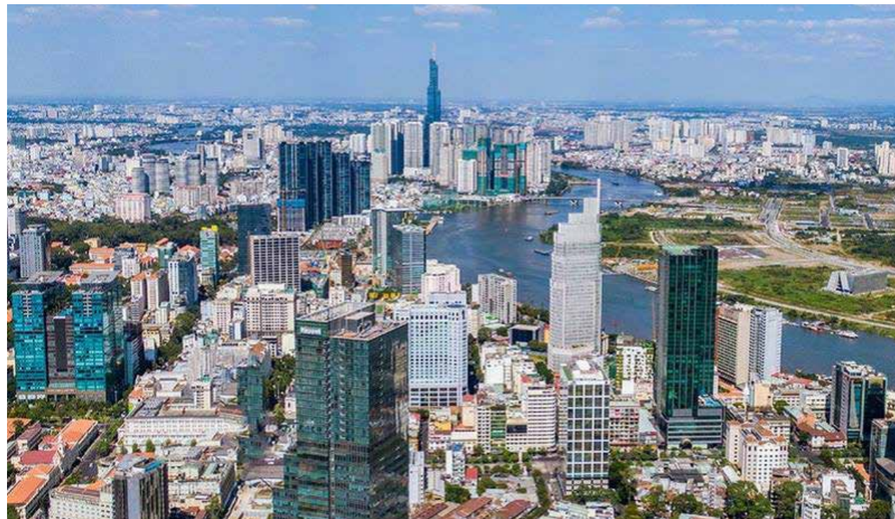
Thị trường nhà ở vẫn ghi nhận những tín hiệu tích cực

VNDirect dự báo thị trường bất động sản có thể gặp khó khăn tạm thời trong Q3/2021 do dịch COVID-19 đang bùng phát, tuy nhiên thị trường sẽ bước vào thời điểm thuận lợi từ Quý 4.