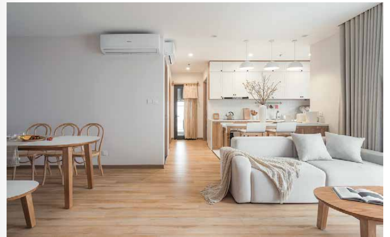
Cách đầu tiên để làm mới không gian là dọn dẹp

"Sau một thời gian sử dụng, có thể nhiều món đã hỏng hoặc công năng không còn phù hợp trong thời điểm này và nên được thay thế. Bạn hãy đem cho hoặc bỏ chúng để nơi ở thêm rộng rãi", ông Minh khuyên. Ngoài ra, nếu có điều kiện, bạn nên dành một phòng hoặc một góc làm kho lưu trữ trong nhà.